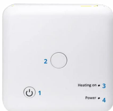
2= koppelknop TC05