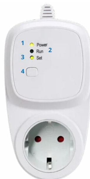
4 = koppelknop TC400